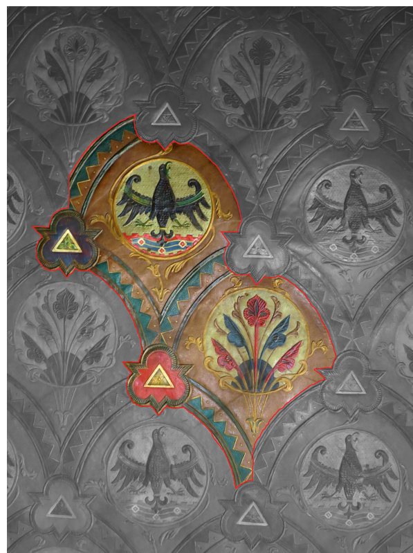
Et udsnit af tapetet i Byrådssalen, hvor man kan se en såkaldt "rapport" med en spejlvendt ørn.

alle ser den forkerte vej. Det blev først opdaget af en kommunal-direktør små 100 år senere.