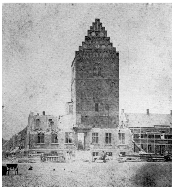
Nedrivningen af det gamle rådhus år 1883.

Arkitekt O. P. Momme havde ikke alene tegnet bygningen, han stod også for udsmykningen af trapperummet, vestibulen, store og lille byrådsal. Alt står uændret, som dengang bygningen var færdig. Den 26. november 1884 holdt byrådet sit første møde i det nye rådhus.