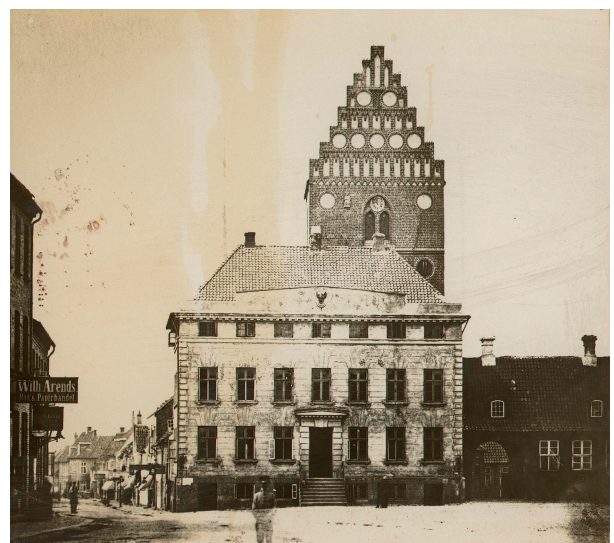
Det gamle rådhus omkring år 1870.

Ombygningen gav god plads og fængselsproblemerne blev løst med hele den nye etage, som kun var arrester med den bedst mulige udsigt over byens torv. Det nye rådhus blev indviet d. 22. oktober 1839. 100 af byens 3.138 indbyggere var med til festmiddagen på Prindsen.